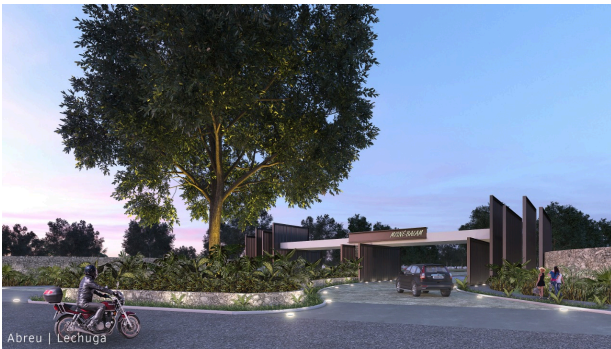
Abreu | Lechuga