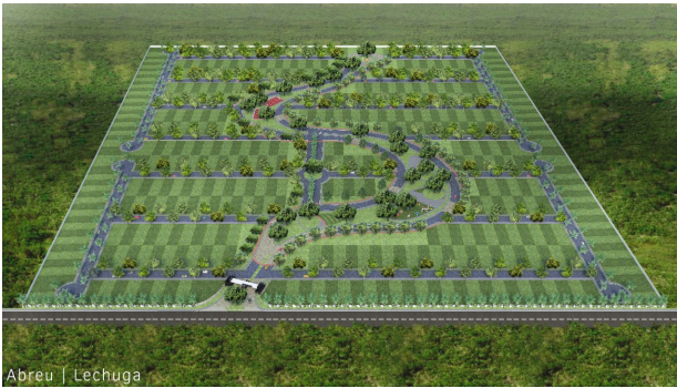
Abreu | Lechuga