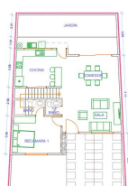
PLANTA BAJA 85.60 m 2