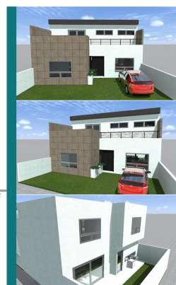
METROS TOTALES 146.25 m 2