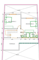
PLANTA ALTA 60.65 m 2